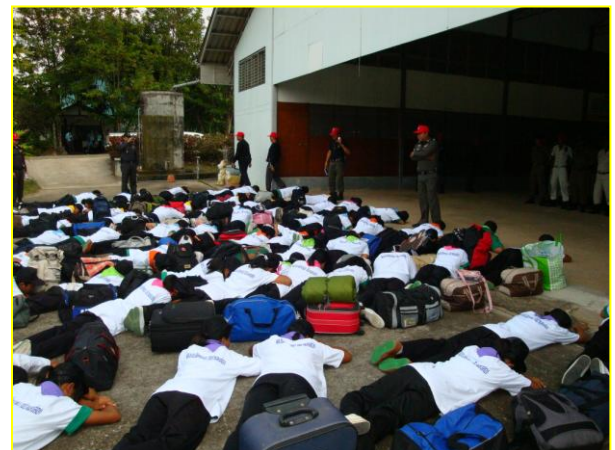
เข้าค่ายวันแรก “ขุวจรรยาต้องมึระเบียบวินัย”