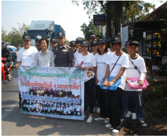
กิจกรรมจิตอาสาบริการนักท่องเที่ยวในช่วงเทศกาลปีใหม่ 2553