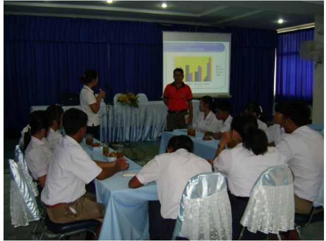
ร่วมวิเคราะห์ข้อมูลของสถานศึกษาเพื่อหาแนวทางแก้ไข