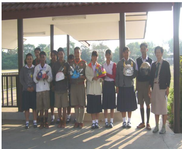
การแข่งขันตกแต่งหมวกนิรภัย

จัดเวทีประชาคมในสถานศึกษาเพื่อลงมติมาตรการความปลอดภัยทางถนนในสถานศึกษา กิจกรรมเพื่อกระตุ้นจิตสำนึกให้กับนักเรียนในสถานศึกษา