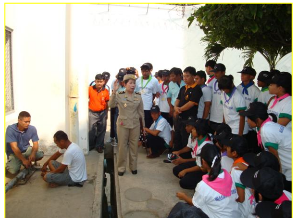
ดูงานเรือนจำกลางจังหวัดนครราชสีมา