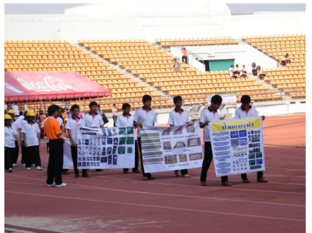
จัดขบวนรณรงค์ในงานกีฬาจังหวัด