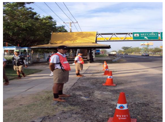
กิจกรรมอาสาจราจรหน้าโรงเรียน