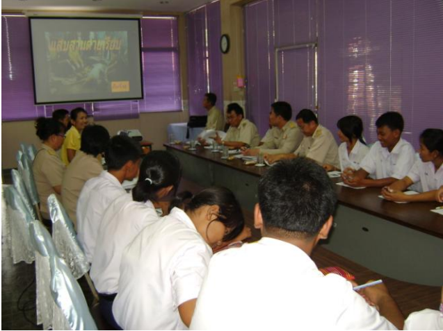
พบปะแกนนำเพื่อชี้แจงวัตถุประสงค์โครงการ