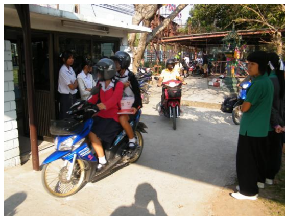
กิจกรรมการสำรวจพฤติกรรมรถสามล้อของนักเรียน