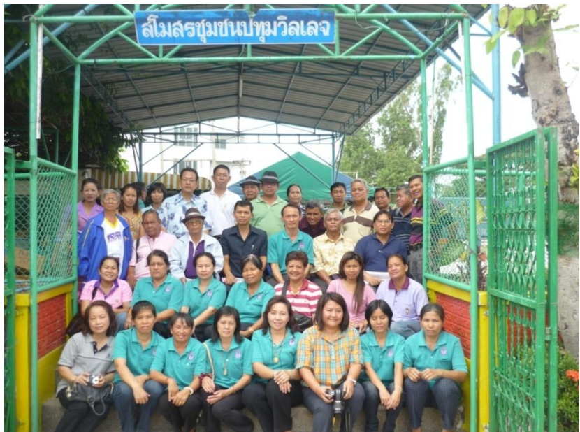
ศึกษาดูงาน ครั้งที่ 2 วันที่ 20 กุมภาพันธ์ 2553 ณ หมู่บ้านสถาพร ถนนรังสิต- นครนายก จังหวัดปทุมธานี