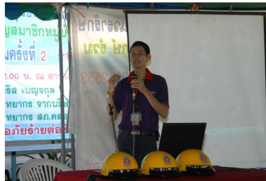
เวทีประชาคมอุบัติเหตุจราจร ครั้งที่ 2