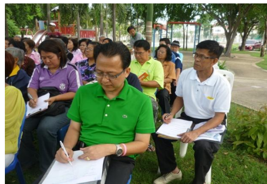
ศึกษาดูงานหมู่บ้านสถาพร