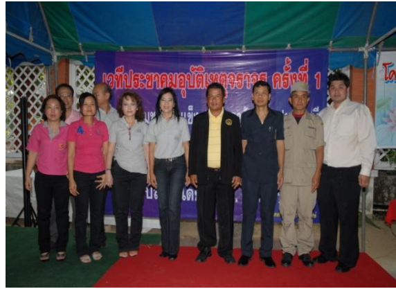
เวทีประชาคมอุบัติเหตุจราจร ครั้งที่ 1