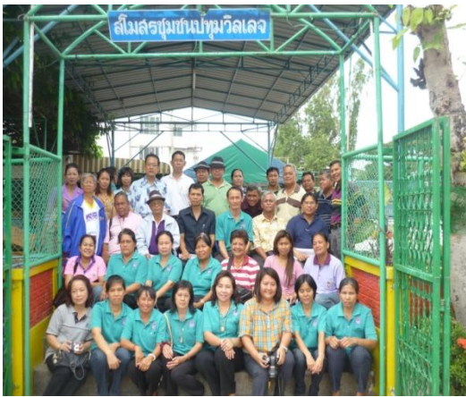
ศึกษาดูงานหมู่บ้านปทุมวิลเลจ